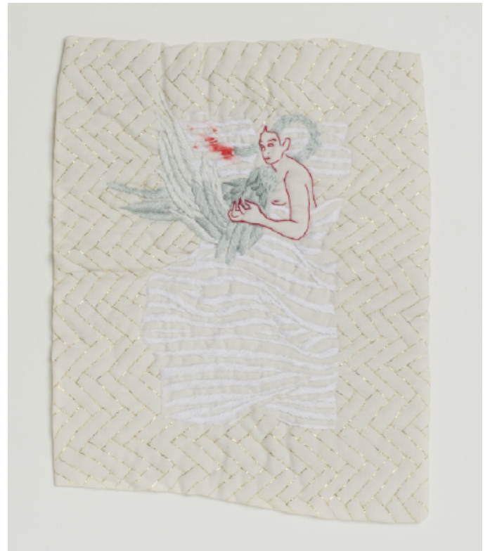
I Don't Know Who You Are Anymore Cuadríptico. Bordado. 22 x 18 cm. cada una (4 piezas). 2023