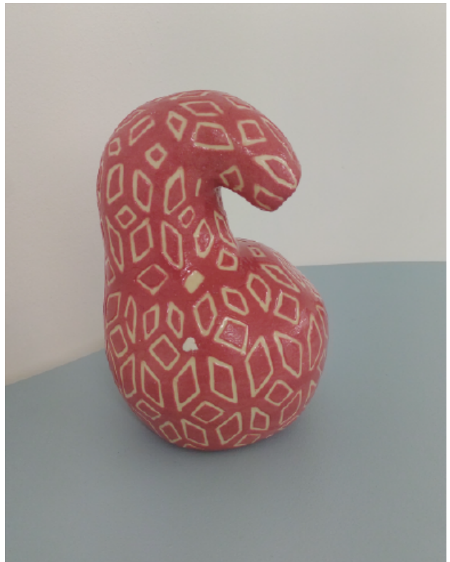
Come Cerámica esmaltada. 20 x 14 x 13 cm. 2023