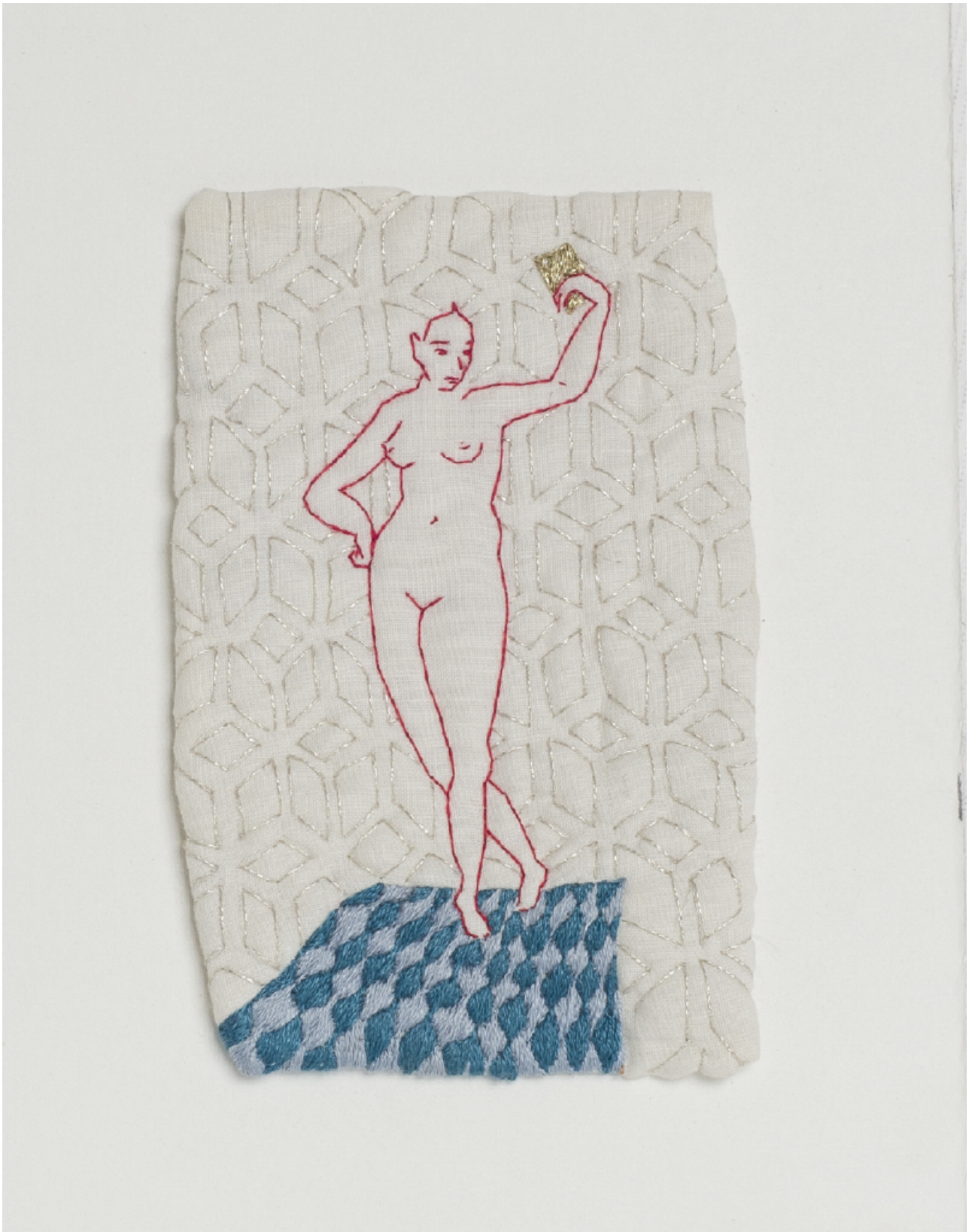
Canto de Victoria Bordado sobre tela. 14 x 9 cm. 2023