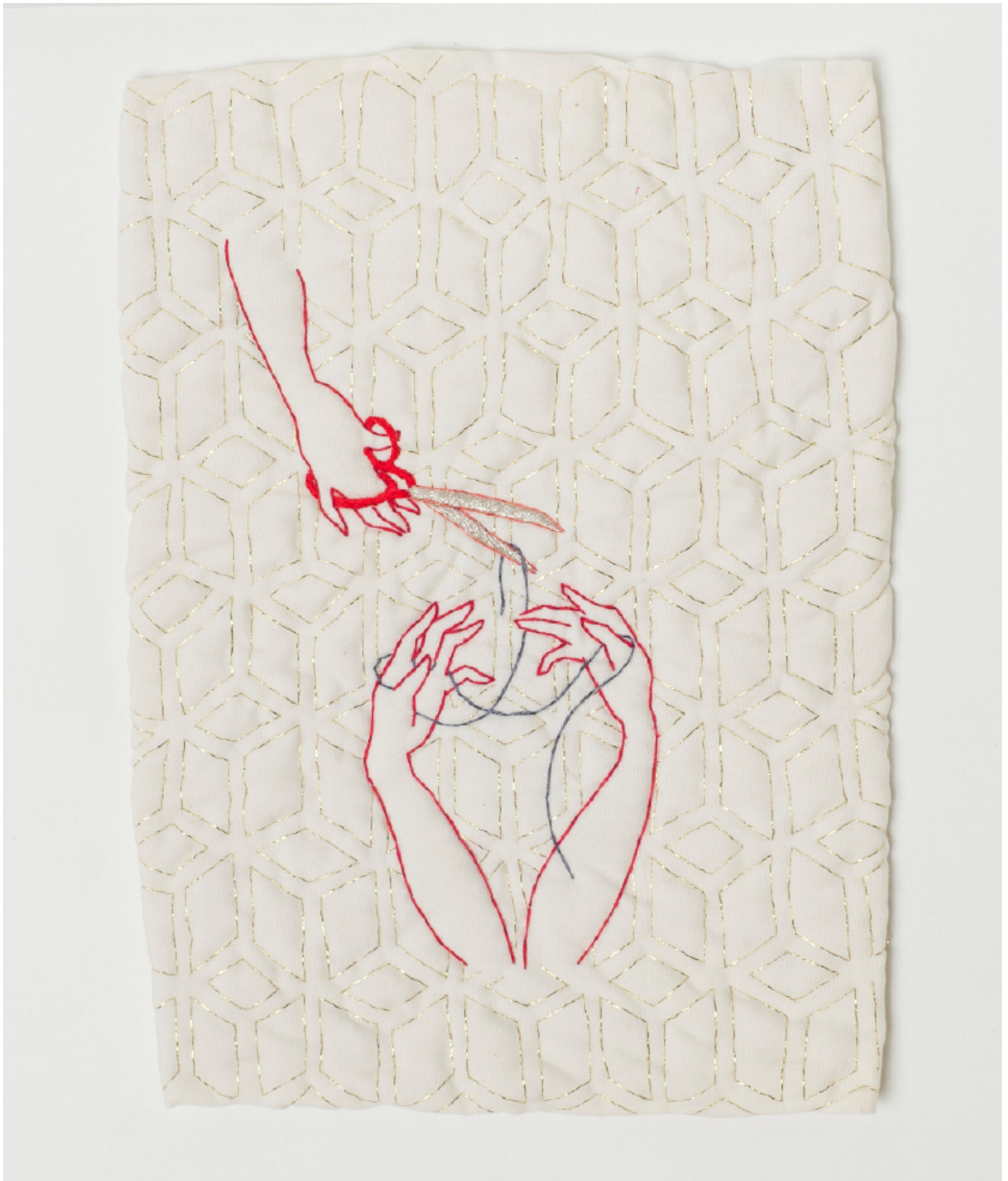
El Corte (detalle) Bordado sobre tela. 24 x 17 cm. 2023